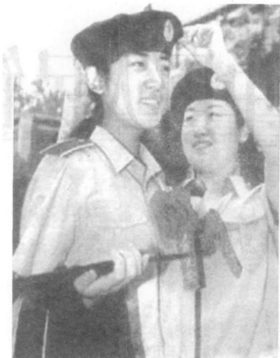
试穿 99 式军服的女兵