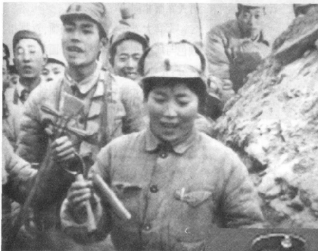
淮海战役时的军服式样

样式与抗日战争时期基本相同,只是不再佩戴“八路军”、“新四军”臂章,服装材料有粗布,也有细布,颜色以土黄色为主,中原军区部队仍着灰色军服。