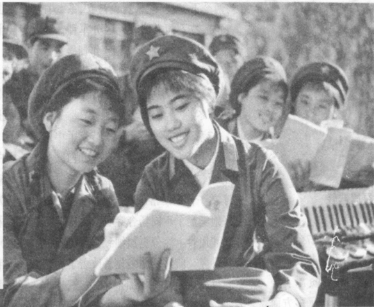
▲“文化大革命”时期的男女军服式样

从1981年开始,我军着手新一轮军服改革工作。1984年1月,中央军委批准了改革方案,并于1985年装备部队,新军服定名为85式。85式军服仍然沿用55式军服样式,仅将解放帽改为大檐帽,佩带圆形“八一”红五