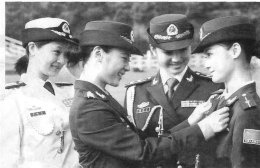
穿着 07 式新军服的女军人

在中国人民解放军建军80周年前夕,经中共中央、中央军委批准,全军从2007年8月1日起陆续换发07式服装,这是我军军服史上的一次全面系统的改革,标志着我军军服建设水平实现了历史性的跨越。