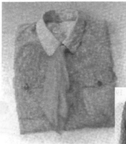
南昌起义时的军服

章,以此象征是一支红色的军队。当时,指战员们的服装主要靠打土豪和战场缴获解决。有什么,穿什么,没有统一的式样。就在这样艰难困苦的环境下,1928年5月,红军在江西宁冈县一座古老的祠堂里,利用极其简陋的工具,建立起红军第一个被服厂——桃寮被