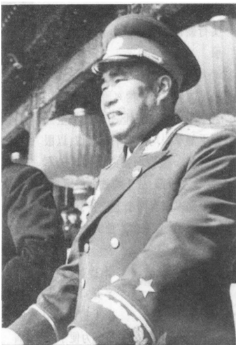
身着元帅服的朱德

55式常服是供军人平时穿着的服装，分夏常服和冬常服两种。军官穿着常服时佩戴军衔肩章、军种领章，大檐帽配圆形“八一”红五星帽徽，校、尉官扎武装带。常服颜色按不同军兵种区分：陆军为棕绿色；空军为上棕绿下蓝色；海军夏常