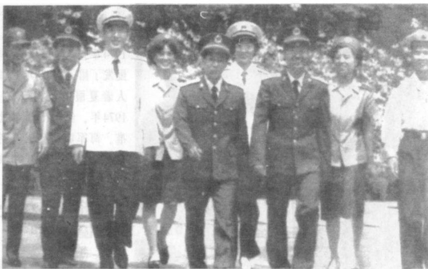
身着 87 式军服的三军官兵

99式夏服陆军为浅棕绿色;海军为增白色;空军为浅蔚蓝色。陆、空军夏服材料均为多异涤棉色织布,将官夏服材料为多异涤毛色织布;海军夏服上衣材料采用多异涤丝凡立丁,将官采用的是多异涤毛平布。男女夏裤采用涤纶长丝仿毛军港呢,陆军颜色为深棕绿色;海、空军为深藏青色。贝雷帽采用国际通用样式,戴着美观大方,同时也较好地解决了广大官兵夏季戴大檐帽太重、太热和不便携带的问题;用料为细羊毛;颜色上,陆军为深棕绿色,海军为深藏青色,